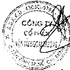
ĐỖ XUÂN QUANG